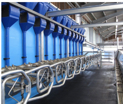
ИНДИВИДУАЛЬНЫЕ КОРМУШКИ ДЛЯ КАЖДОЙ КОРОВЫ

Результаты принятых решений подытоживаются, и наблюдение начинается заново